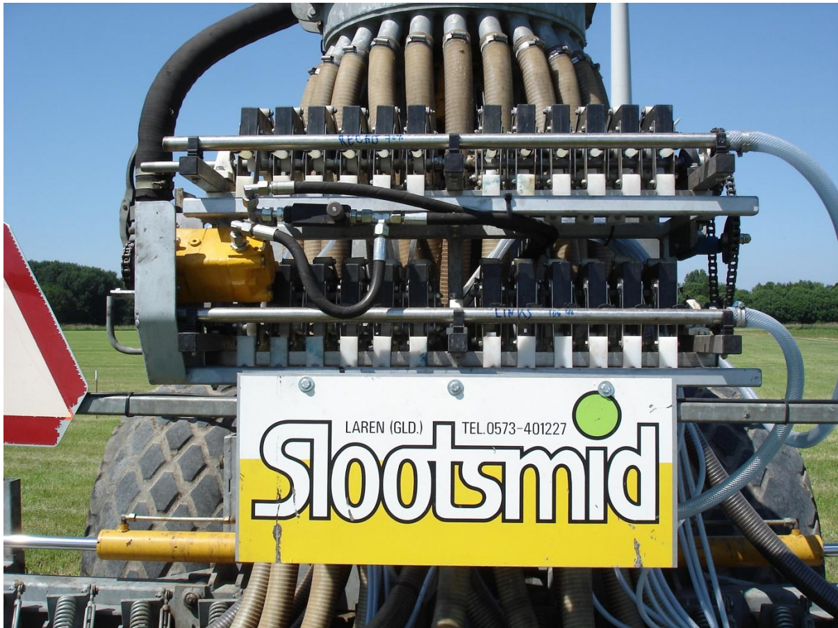
Figuur 3. Slangenpomp achterop de mestmachine voor de dosering van vloeibare kunstmest