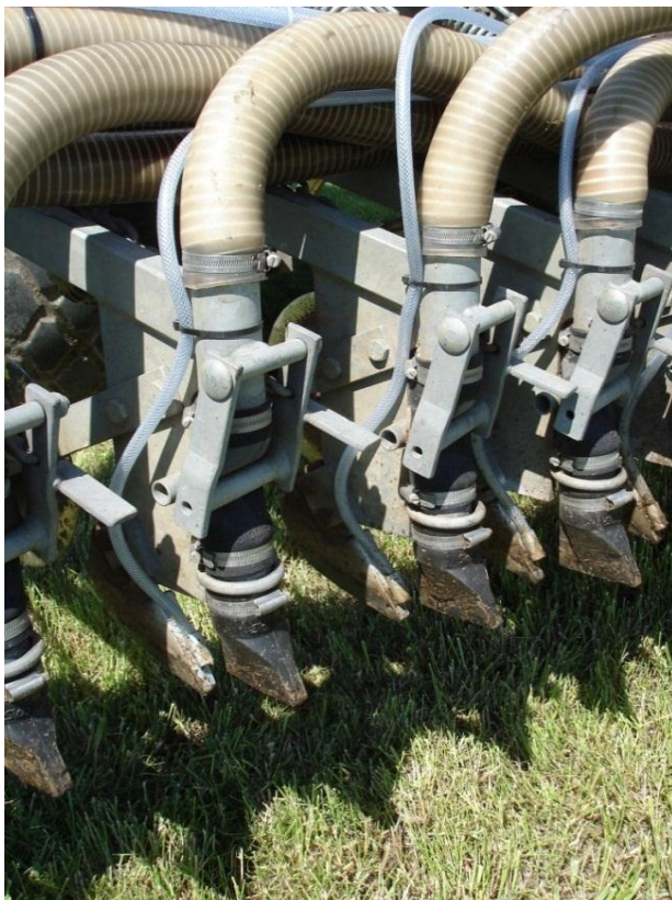
Figuur 2. Detailfoto mestinjecteur