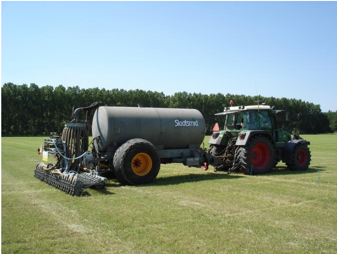
Figuur 1. Uitrijden vloeibare meststoffen in combinatie met drijfmest met de zodebemester-PPL